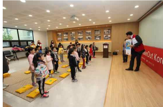
서울 본사 희망브리지홀